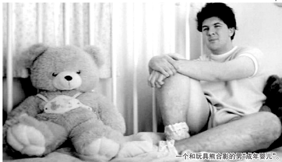
一个和玩具熊合影的男“成年婴儿”。

“你多大？”当记者问一个身着蕾丝儿童样式纱裙的成年女子，她回答“我不知道，可能我的爸爸妈妈知道”。“我们不希望和孩子玩，还是成为孩子。”因为这种想法，英国男子艾伦失去了朋友和恋人。