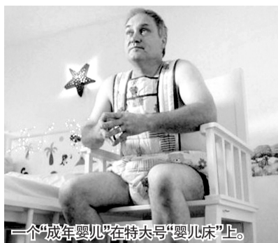
一个“成年婴儿”在特大号“婴儿床”上。