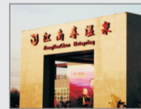
27000m 2 江南春温泉