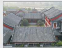
5500m 2 山湖别院