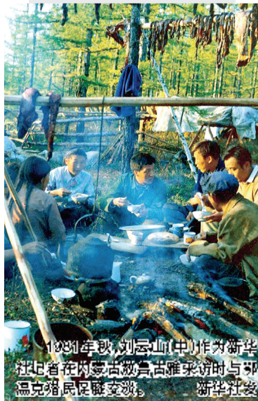
1981年秋，刘云山（中）作为新华社记者到内蒙古敖鲁亚雅采访时与鄂温克猎民座谈。