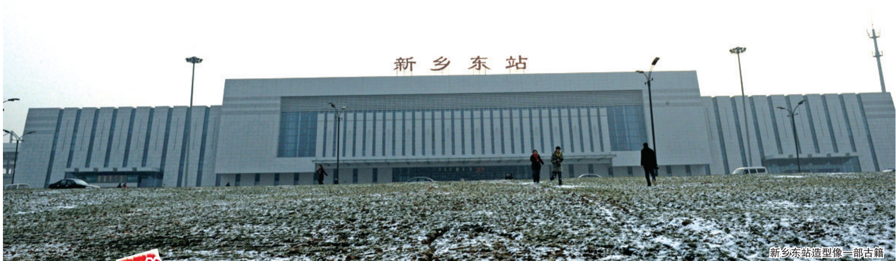
新乡东站造型像一部古籍