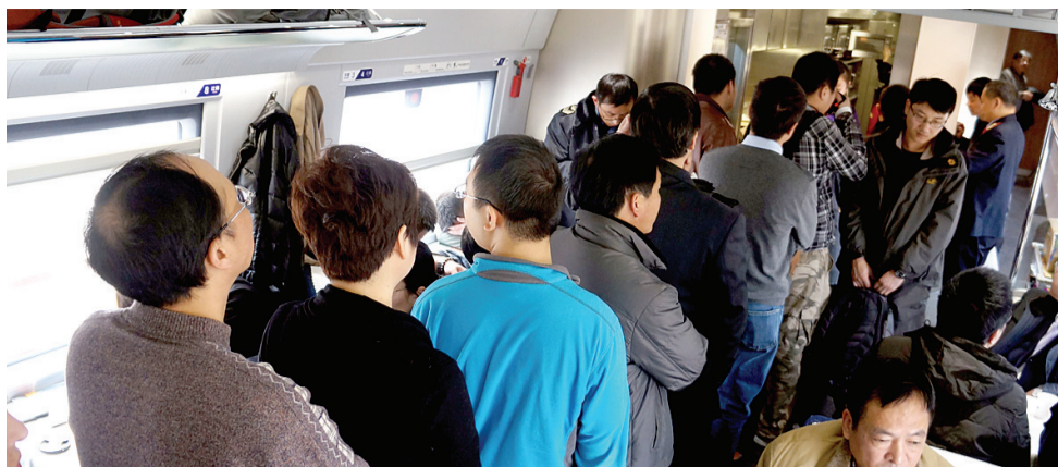
在G79次高铁上，等待购餐的旅客队伍排了一车厢长。