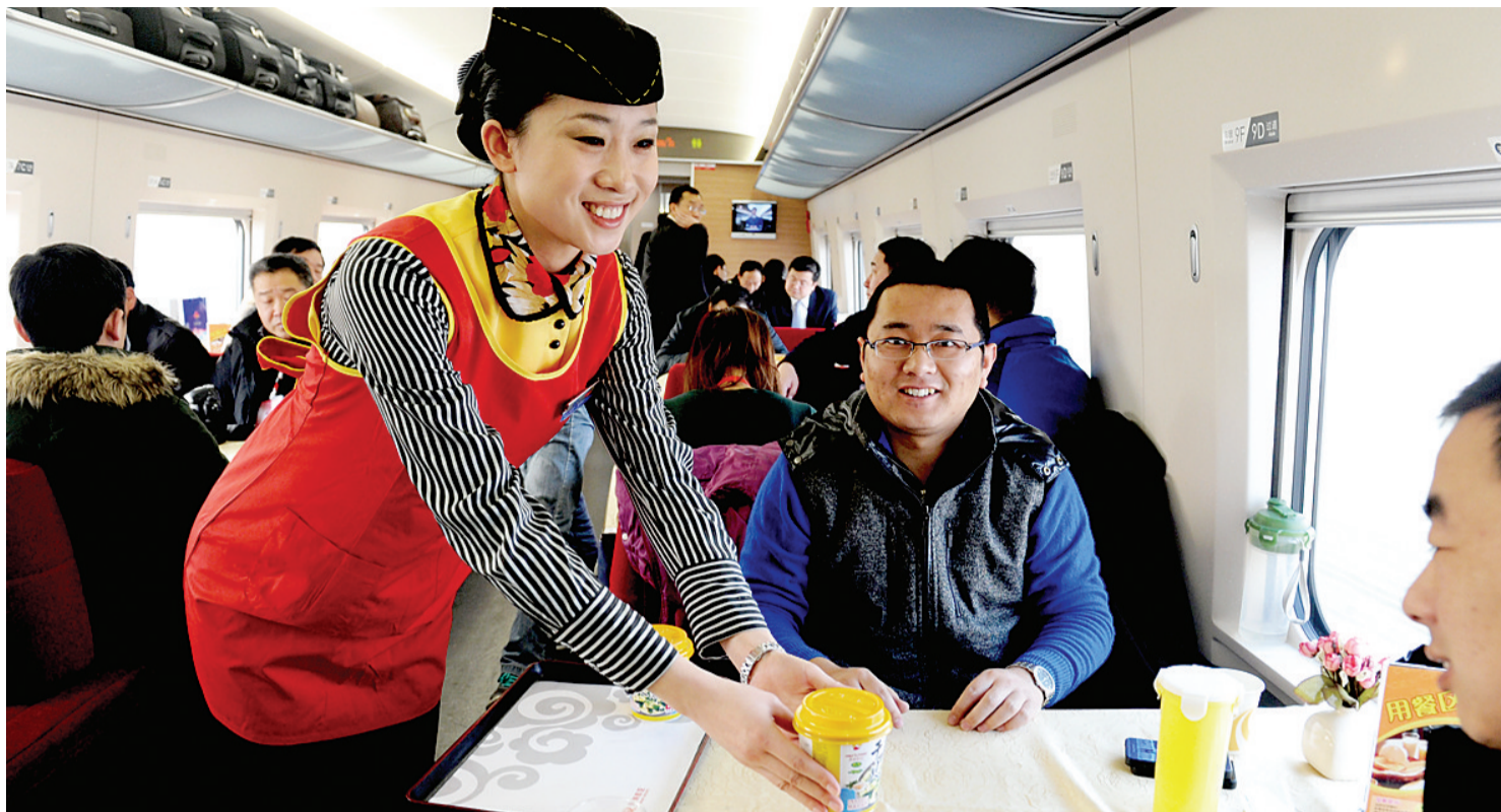
餐车服务员在为旅客送餐。