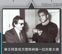
拳王阿里成为雪铁纳第一位形象大使