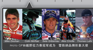
Mike Doohan Colin McRae Sete Gibernau Alex Criville Thomas Lüthi Moto GP 和越野拉力赛冠军成为 雪铁纳品牌形象大使