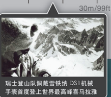
瑞士登山队佩戴雪铁纳 DS1 机械手表首度登上世界最高峰喜马拉雅

1960 登山 1970 入海 1970 力量 1995-2005 速度 2005 可靠和值得信赖 2006-2011 运动魅力