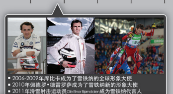
2006-2009年库比卡成为了雪铁纳的全球形象大使 2010年佩德罗·德雷罗萨成为了雪铁纳的形象大使 2011年滑雪射击运动员Ole Einar Bjørndal成为了雪铁纳代言人