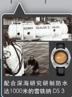
配合深海研究研制防水达1000米的雪铁纳 DS 3