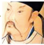
@大哥李白二哥李逵:

我是做礼品生意的,2013年我希望经济持续回暖,结合河南地域文化,挖掘河南文化根基,争取用礼品来传递河南深厚的文化底蕴,成为河南的一张名片。