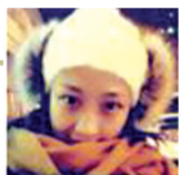
@张小琳是个火锅妹:

对于郑州人来说,这一年也充满了各种酸甜苦辣,我们和这座城市一起,经历着成长和蜕变。在辞旧迎新之际,普普通通的郑州人,又是如何展现的呢?通过微博私信,我们采访了100位郑州市民。 记者 张翼飞