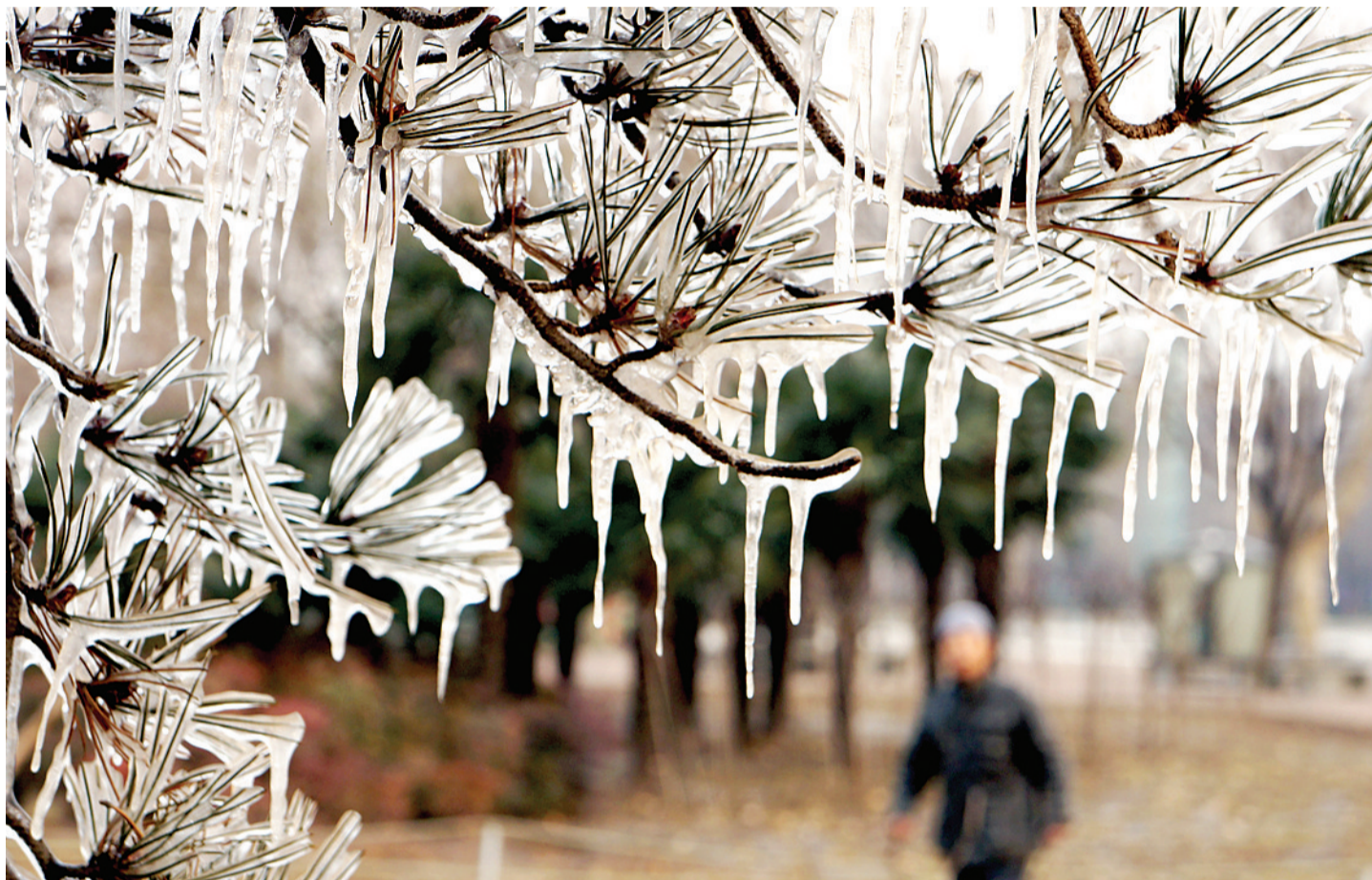
昨天下午,绿城广场,由于温度过低,喷头喷出的水喷在雪松叶子上形成美丽的冰花。

中央气象台4日发布的未来3天全国天气预报显示,南方地区雨雪天气将持续,贵州湖南等地有冻雨,新疆北部有降雪天气。 据新华社