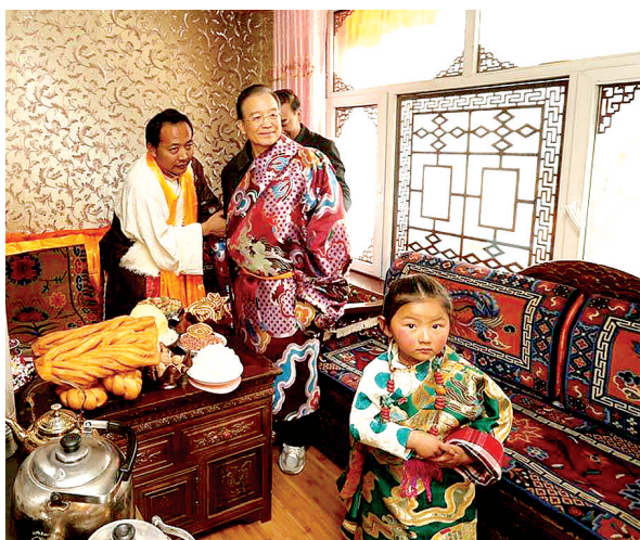
2013年元旦前夕，中国国务院总理温家宝来到青海玉树藏族自治州州府所在地结古镇，考察地震灾后恢复重建情况。这是2012年12月31日，温家宝在折龙达社区巴德加措家中了解居民生产生活情况时试穿藏袍。 新华社发