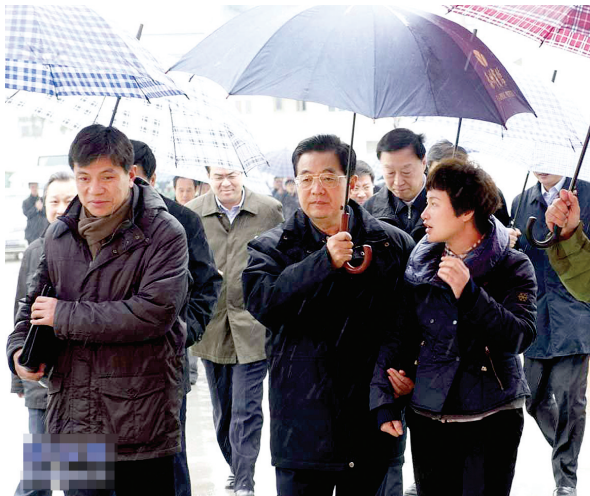
2012年12月26日至29日，国家主席胡锦涛在江苏考察工作。这是胡锦涛在盐城市恒北村考察时为讲解的村支书打伞。

中共中央政治局改进工作作风“八项规定”出台满月 中央领导到外地考察，一路轻车简从，不封山、不封路 中央会议压缩会期，鲜花没了，简报短了 各地各部门积极跟进，结合实际贯彻“八项规定”