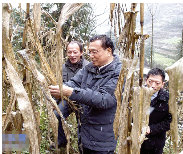
2012年12月27日至30日，中共中央政治局常委、国务院副总理李克强到江西九江、湖北恩施调研。这是12月29日，李克强在湖北恩施龙凤镇青堡村，踩着泥滑山坡道攀上路边陡坡，察看挂坡地种植的艰难。