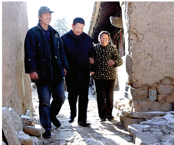
2012年12月29日至30日，中共中央总书记、中央军委主席习近平在河北省阜平县看望慰问困难群众。这是习近平在龙泉关镇骆驼湾村看望唐荣斌老人一家。