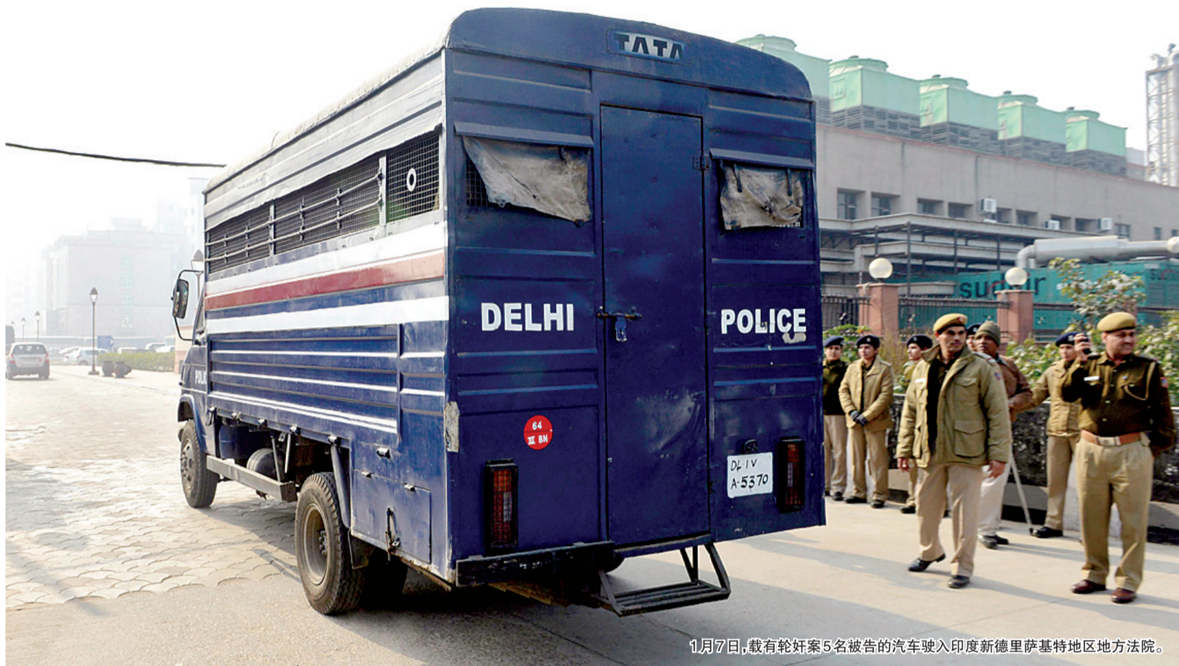
1月7日,载有轮奸案5名被告的汽车驶入印度新德里萨基特地区地方法院。