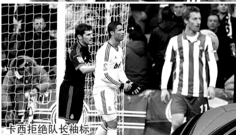
卡西拒绝队长袖标