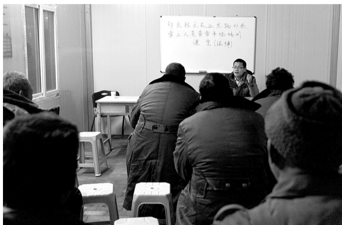
如意湖办事处外来务工人员临时劳务市场开展培训课堂。