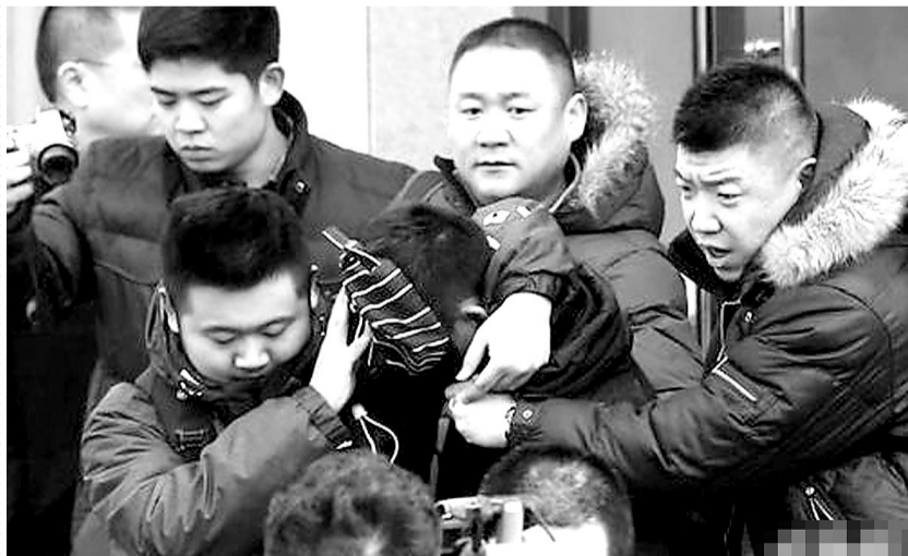
图为嫌犯被警方带走