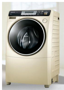
松下斜式滚筒洗衣干衣机阿尔法系列成市场新宠

在新年具有烘干功能和除菌技术的高端滚筒市场非常畅销。其中,松下斜式滚筒洗衣干衣机阿尔法系列,凭借智能烘干和创新除菌技术,成为 2013 年洗衣机市场上的高端“代言人”。 朱江华