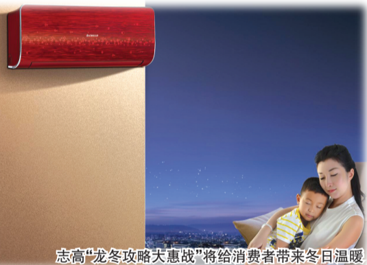
志高“龙冬攻略大惠战”将给消费者带来冬日温暖

近 3 个月来,一场由志高空调发起的“龙冬攻略大惠战”引爆了整个冬季空调市场。据了解,此次促销活动不仅力度大,而且形式新颖、涉及面广,在全国各地引起了广泛关注和反响。 朱江华