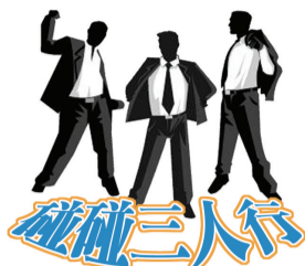
总第 183 期