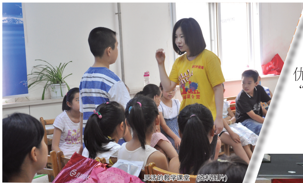
灵活的教学课堂 (资料图片)

格式不对。仿句题型繁多,除一般仿句类型外,可以对联仿写,也可在对联中加入名著知识点仿写。另外,古诗考察的范围很广,不仅有小学课标中要求的,还有课外古诗词名句积累。还要注意材料题、图表题、漫画题也逐渐登上小升初的舞台。