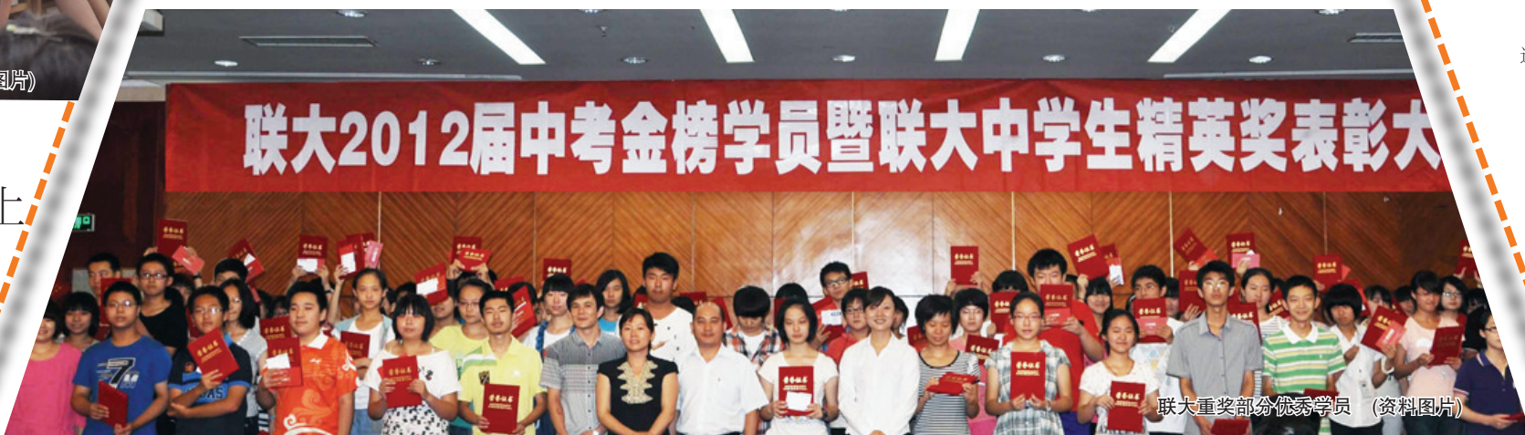
联大重奖部分优秀学员 (资料图片)

据悉,今年寒假,联大将再次推出针对初中和高中多种班型,助其短期内提高成绩。 记者 唐善普