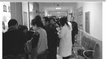
图为丰益肛肠医院“10元查痔”活动现场

丰益专家解释,肛周脓肿是在肛门直肠周围软组织内或其周围间隙内发生的急性或慢性化脓性感染,并产生脓肿。患者可用手在肛门周围或臀部上摸到有“小包”样的肿块,后期发展会有疼痛感,有的对疼痛敏感的患者会表现得较为剧烈,坐立难安,也有的伴有发烧的情况出现。如果是肛周脓肿引起的肛门肿胀、疼痛,患者在早期是最不容易发现的,待到症状出现时,脓液其实已经在肛门直肠的软组织之间“穿梭”了。该病发展到中后期,还会形成肛瘘,脓液“穿”出多条脓腔瘘道,致使臀部形成“马蜂窝”似的瘘道口。