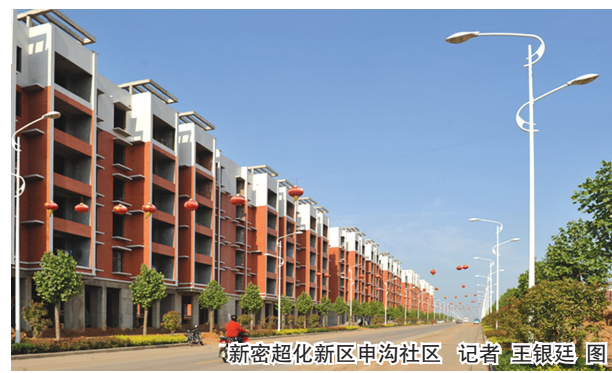
新密超化新区申沟社区 记者 王银廷 图