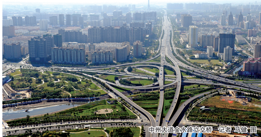
中州大道金水桥立交桥