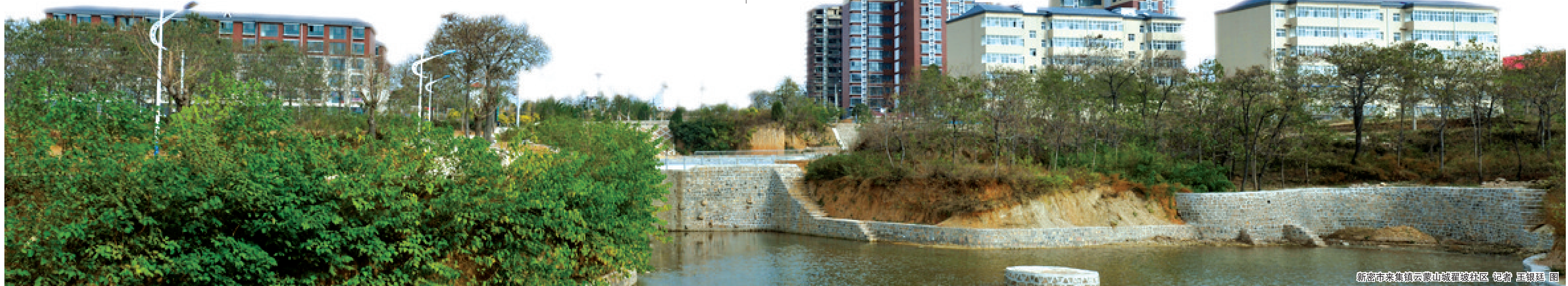
新密市来集镇云蒙山城翟坡社区