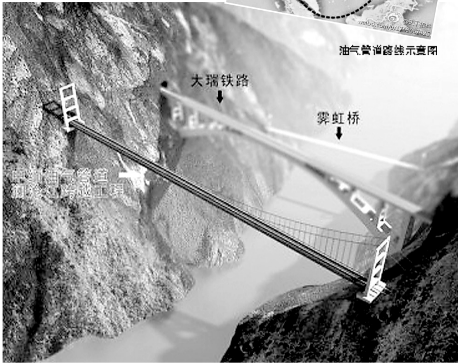
油气管道横跨澜沧江工程