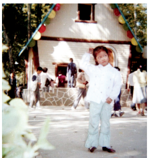
李娜儿时在武汉中山公园拍照留念