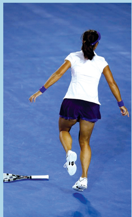
“我当时觉得医生的手指挺逗的，感觉就像家长带着孩子去儿童医院。”李娜赛后说