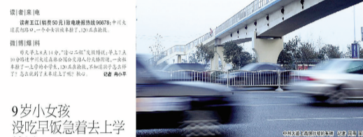
9岁小女孩没吃早饭急着去上学结果……快放假了,孩子们更要注意安全 (24日本报报道)

马路,而就在他们身边南侧20米,就是人行天桥。 李颖说,放假期间是儿童交通事故的多发期,家长不仅要经常对孩子讲安全知识,而且要以身作则,自觉遵守交通规则,按信号灯行止,不翻越交通护栏,骑电动车不抢道不逆行,使儿童在潜移默化中学会安全的交通行为。