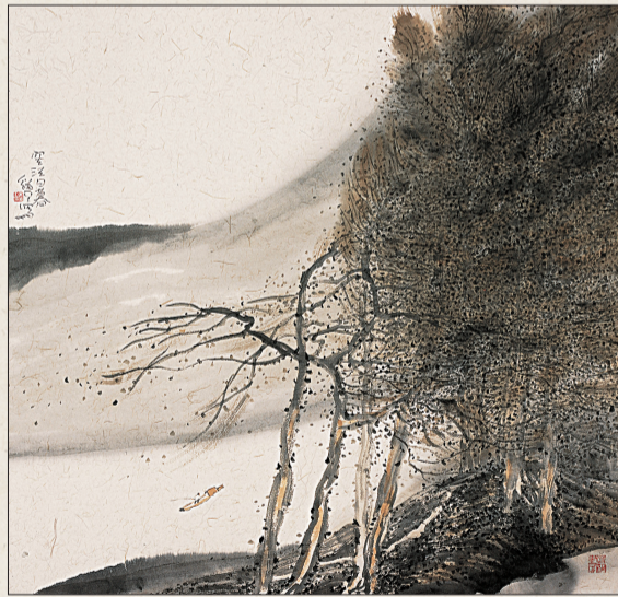
空江日暮 65cm x 67cm

其实,忙碌的我,太羡慕道平先生,因为他在生命和艺术双重本体价值中找到了自我,他寡言“主义”,慕前贤,勇探索,勤笔耕,以量和质的交相迭替,实现着一个“飞跃”。故他的真情、真切的绘画世界,将每个生命的点融化,也使得每个点充盈着生命。