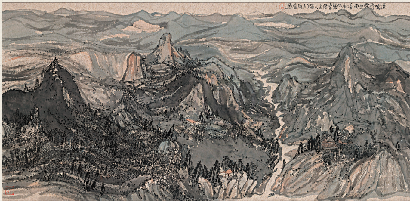
遥忆彩云之南 68cm x 136cm