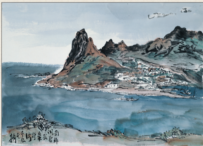
南非开普敦豪特湾 32cmx44.5cm

2012年出版有《中国当代名家画集·范扬》《范扬画集》等。设计的《太湖》《普陀秀色》等邮票由国家邮政总局正式发行。当选《美术报》2012年十大年度人物，并当选新一届的中国教育学会美术教育专业委员会理事长。