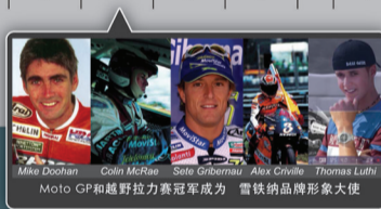
Moto GP和越野拉力赛冠军成为雪铁纳的品牌形象大使