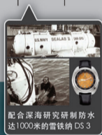
配合深海研究研制防水达1000米的雪铁纳DS3