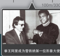
拳王阿里成为雪铁纳的第一形象大使