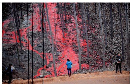
事故现场的林子里出现的红色液体(2月1日摄)。

昨日18时30分，人民日报官方微博：人民日报记者王汉超从河南省交通厅得到消息：供南半幅临时架设的金属材料已运达现场，据计算，南半幅实现临时通车大约还要15天。