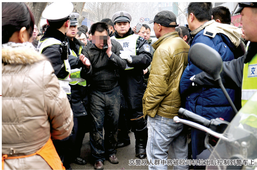
交警从人群中将被殴司机拉出后控制到警车上。

经八路巡防队员李四信来电:经六路纬三路向北100米水产市场门口发生一起车祸,一名6岁的小男孩被碾压,医生说不行了。 记者 冉小平/文