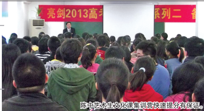
陈中艺术生文化课集训营快速提分有保证。

近日,记者从郑州晨钟(陈中)教育集团获悉,陈中高考学校艺术生文化课集训营今年将充分利用郑州市优质教育资源和独立校园的优势再推优质班型,以一流的师资、专业化团队、特色教学等措施,让优质教育资源真正倍增,帮助广大艺考生冲刺名牌重点大学。 记者 吴幸歌