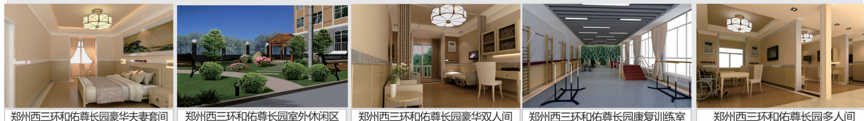
郑州西三环和佑尊长园豪华夫妻套间