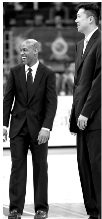
马布里(左)和王治郅

首先就是全明星赛新人的表现出彩。CBA全明星周末星锐赛23日粉墨登场，王治郅担任主帅的南区星锐队以84：77击败马布里挂帅的北区星锐队，