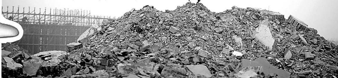
淮河路西环路附近,大面积的建筑垃圾没有遮挡。