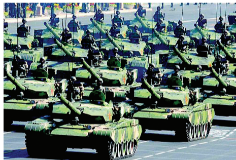
我军新型坦克编队