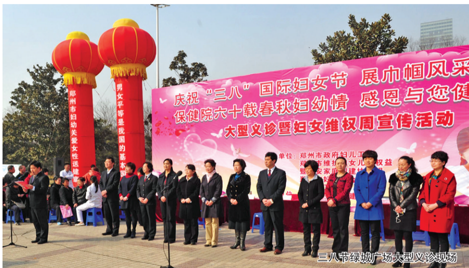
三八节绿城广场大型义诊现场