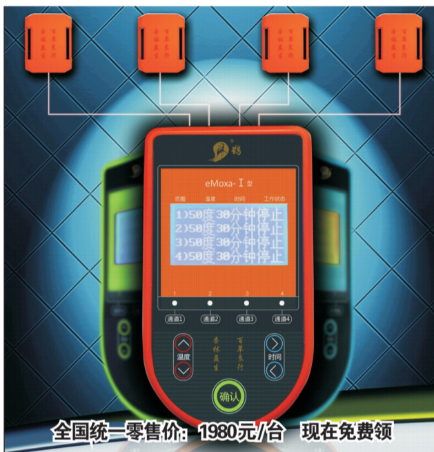
全国统一零售价: 1980元/台 现在免费领