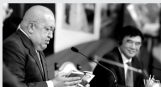
2011年11月24日,查韦斯在接待中国代表团时手拿一本毛泽东书籍。