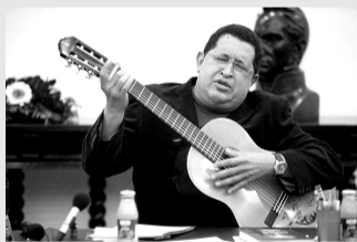
2012年9月20日,查韦斯在加拉加斯的米拉弗洛雷斯宫演奏吉他。