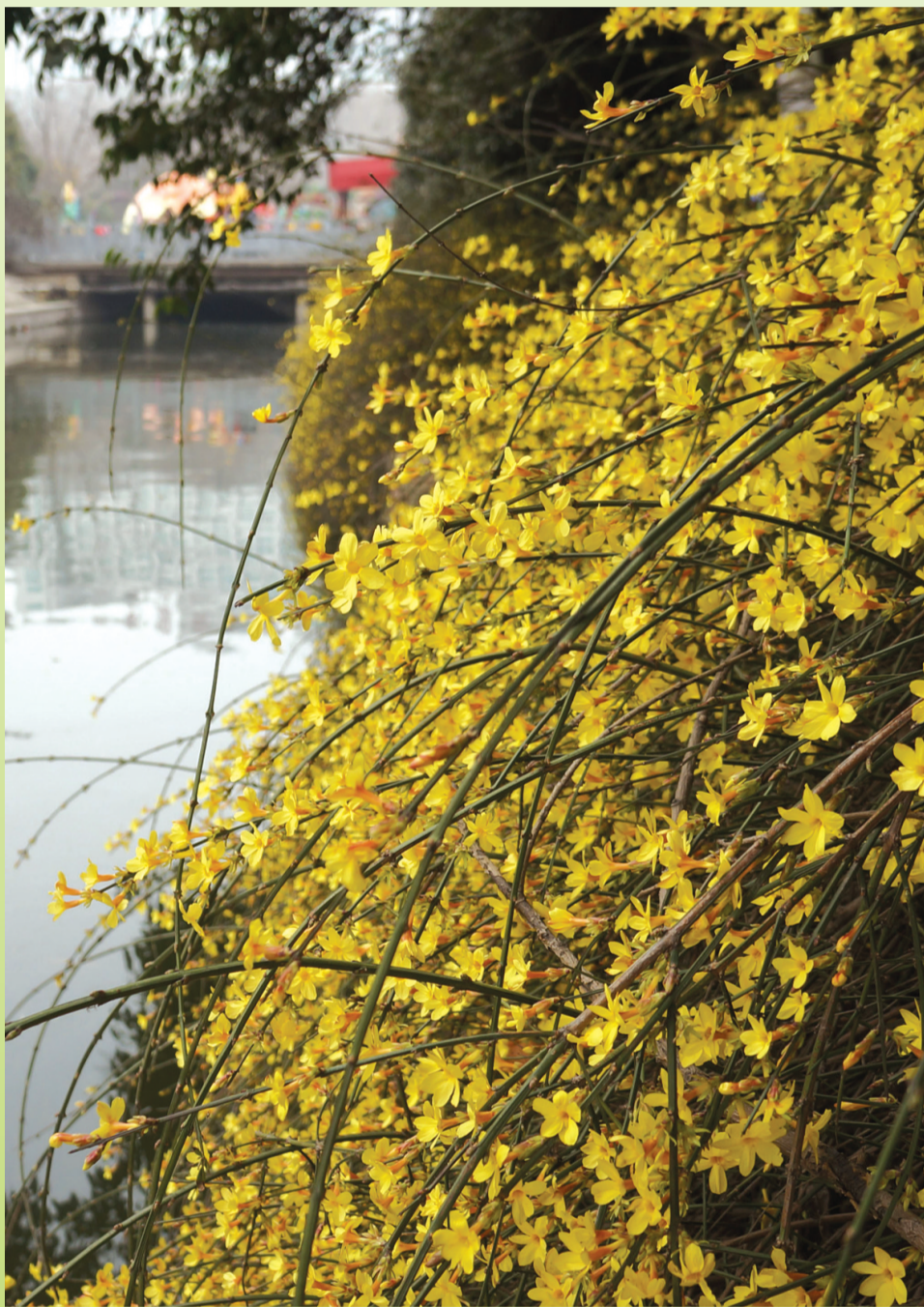
人民公园河岸边盛开的迎春花

迎春花,别名金腰带、串串金、黄梅,是木犀科茉莉属落叶灌木,因其在百花之中开花最早,花后即迎来百花齐放的春天而得名,与梅花、水仙和山茶花统称为“雪中四友”,是中国名贵花卉之一。因其花色端庄秀丽,气质非凡,而且具有不畏寒威、不择风土、适应性强的特点,历来为人们所喜爱。