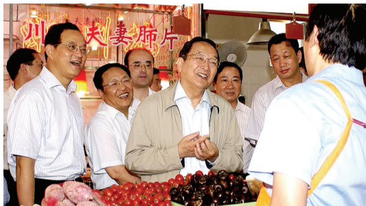
2010年6月，俞正声在上海市徐汇区调研

“有问题，提出来，在哪里发生的什么事，有什么顾虑，告诉我们，坦诚相见才能肝胆相照。”2002年湖北省政协八届五次会议期间，时任中共湖北省委书记的俞正声在听取委员意见建议时说了这样一席话。