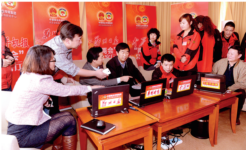
两会期间，市领导赴京看望慰问中原报业传媒集团全媒体新闻中心全国两会北京报道团队特派记者。