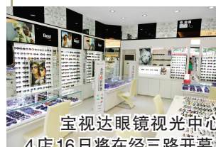
宝视达眼镜视光中心 4店16日将在经三路开幕