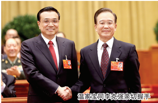
温家宝同李克强亲切握手

十二届全国人大一次会议15日上午在人民大会堂举行第五次全体会议，决定李克强为中华人民共和国国务院总理。国家主席习近平签署第一号主席令，根据大会决定，任命李克强为中华人民共和国国务院总理。