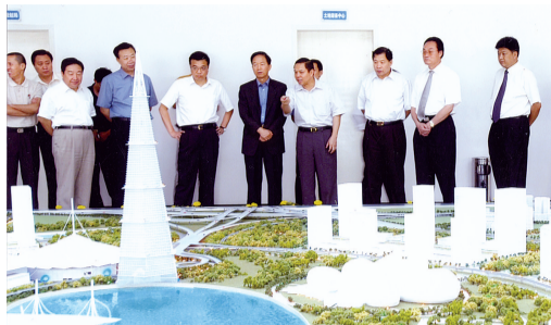
2003年6月，李克刚到郑东新区调研。