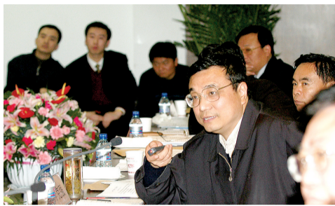
2003年11月7日，李克刚到郑东新区调研。