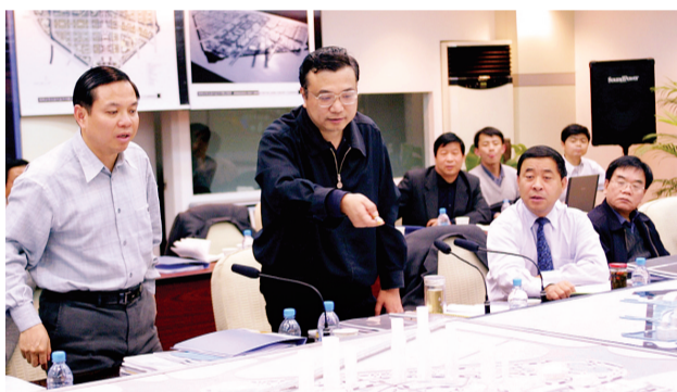
2001年11月21日，李克听取郑东新区规划情况汇报。

21世纪初，河南省委、省政府，郑州市委、市政府作出建设郑东新区的重大决策，背景主要有以下三个方面：一是把郑州建设成为国家区域性中心城市需要，二是顺应全国快速城镇化大势的需要，三是推动我省城镇化进程的需要。