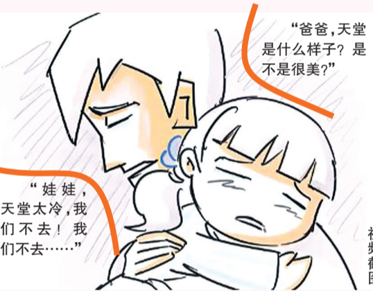
“爸爸,天堂是什么样子?是不是很美?”