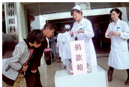
小秀丽和叔叔向爱心人士鞠躬致谢。

“娃娃早日康复,挽留初放的生命,别去天堂,那儿太冷!”网友“大侠那那那”的这句话,代表着所有人的心声。