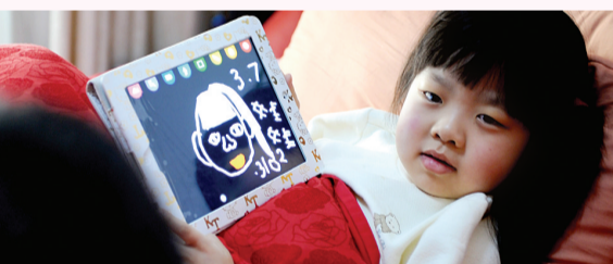
爱画画的娃娃向大家展示自己的作品