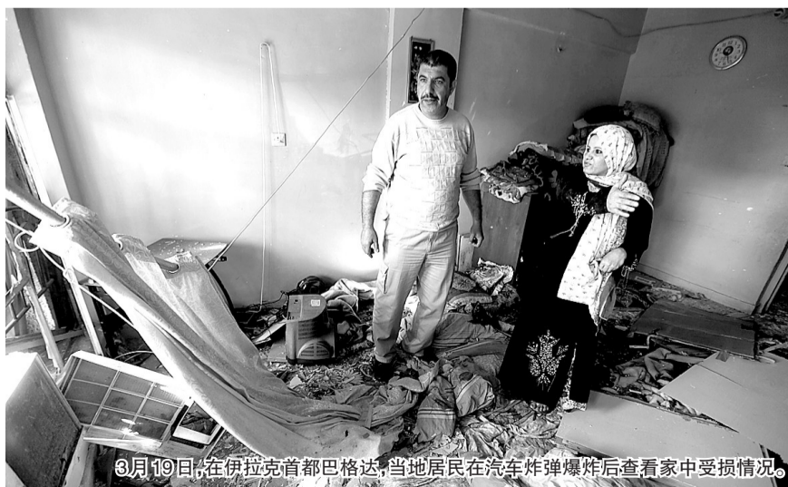
3月19日,在伊拉克首都巴格达,当地居民在汽车炸弹爆炸后查看家中受损情况。

19日,美国发动伊拉克战争十周年,伊拉克首都巴格达和周边城镇当天发生多起爆炸袭击,56人丧生,200多人受伤,凸显伊拉克局势距离稳定依然遥远。