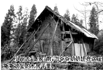
小丹去“婆家”前,与爷爷奶奶住在这座摇摇欲坠的木房子里。