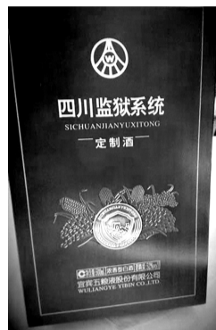
网友上传的「监狱定制酒」图片

在厉行勤俭节约、严格限制公款消费的大背景下,民众对于所谓政府机关定制的高端白酒愈发敏感。19日,有网友在微博上以图文的形式爆料,四川监狱系统在五粮液酒厂定制了价格不菲的专用酒,迅速引发不少网友围观。