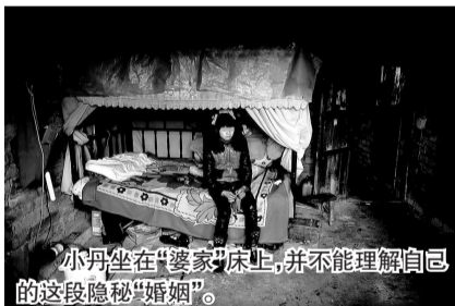
小丹坐在“婆家”床上,并不能理解自己的这段隐秘“婚姻”。