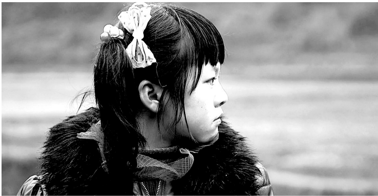
面对将来生活的选择,小丹倍感迷茫。