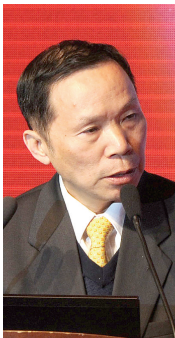
国家发改委宏观经济研究院副院长陈东琪

对于目前的“国五条”房地产调控政策,秦虹没有预测,只称下一步的调控政策应依据当前房地产市场的实际情况来做出,但是现在政府出台调控政策出发点是正确的,政府就应该解决房地产市场发展不平衡的问题。