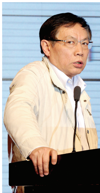
北京华远地产董事长任志强