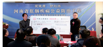
●中华医学基金会为郑州肛泰肛肠医院提供了一百万的援助基金,有效地解决了患者看病贵的难题