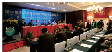
●与中国肛肠病研究院实现合作联盟,联合举办肛肠学学术峰会,100多名权威专家进行学术交流