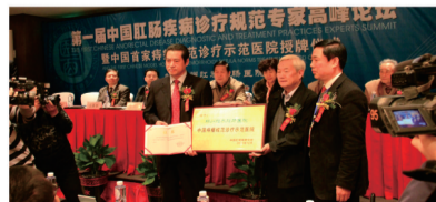
●中国肛肠病研究院授予郑州肛泰肛肠医院“中国首家痔瘻规范诊疗示范医院”,实现肛肠病规范诊疗