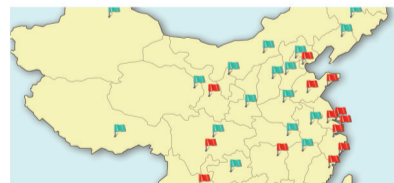
●全国已开设18家专业肛泰肛肠连锁医院,借助肛泰连锁品牌优势,成功实现专家、技术等资源共享