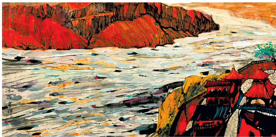
《冰河》 60cm x 120cm 纸本彩墨 焦书晖