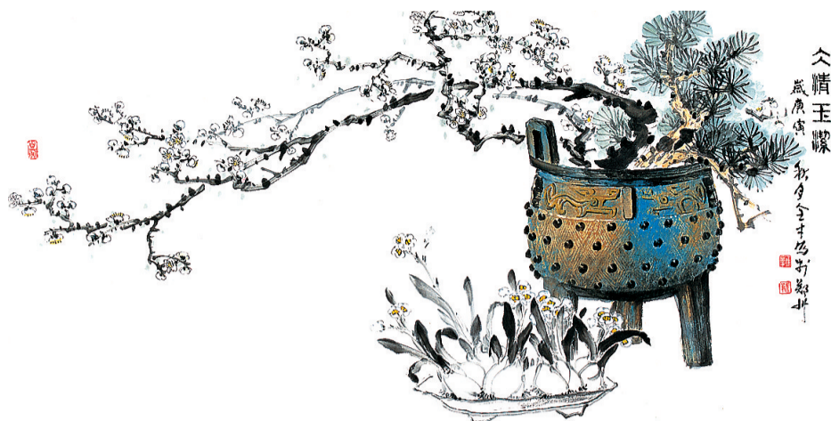
《冰清玉洁》 60cm x 120cm 纸本水墨 焦全才