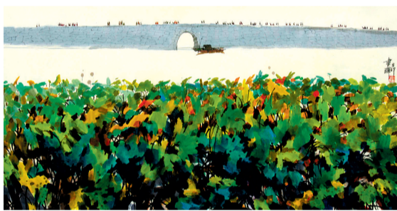
《夏之断桥》 60cm x 120cm 纸本彩墨 焦书晖