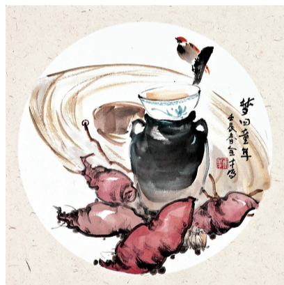
《梦回童年》 40cm x 40cm 纸本水墨 焦全才