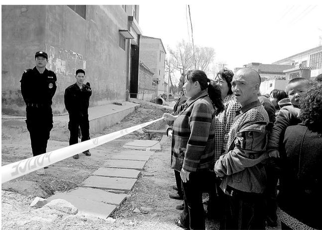
昨日中午,武庄村西南几十户人家被警戒线隔离,部分不能回家的村民站在警戒线外焦急地等候。