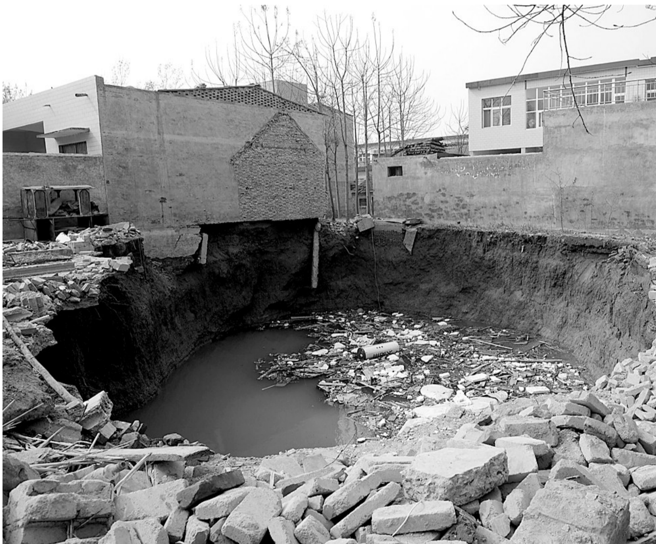
这所院落完全陷进深水坑中