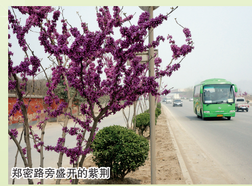
郑密路旁盛开的紫荆