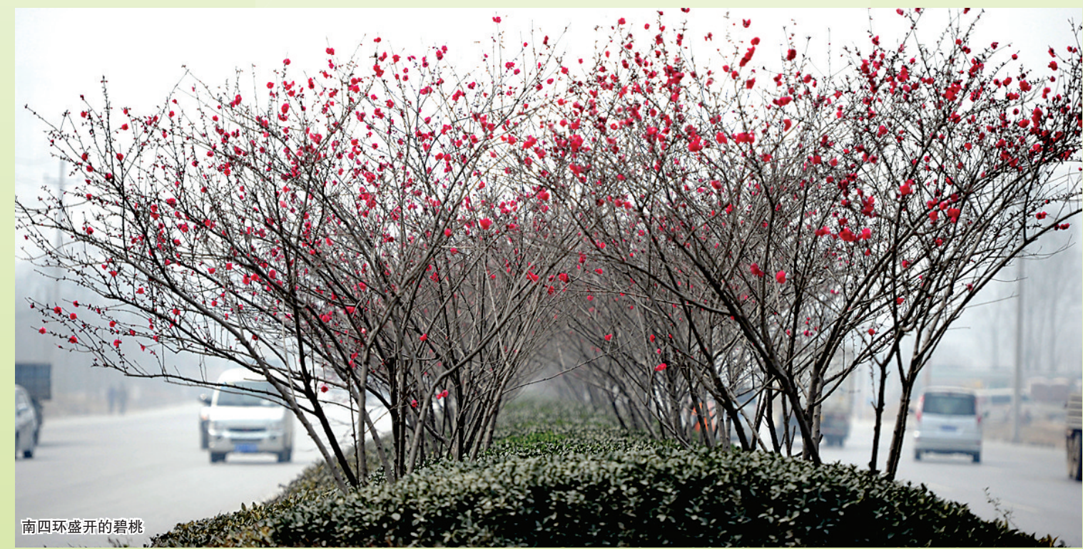
南四环盛开的碧桃