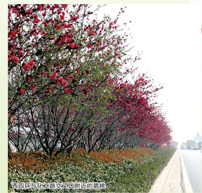
西四环与化工路交叉回附近的碧桃