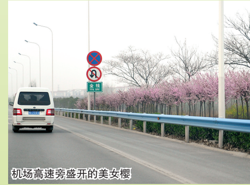
机场高速旁盛开的美女樱