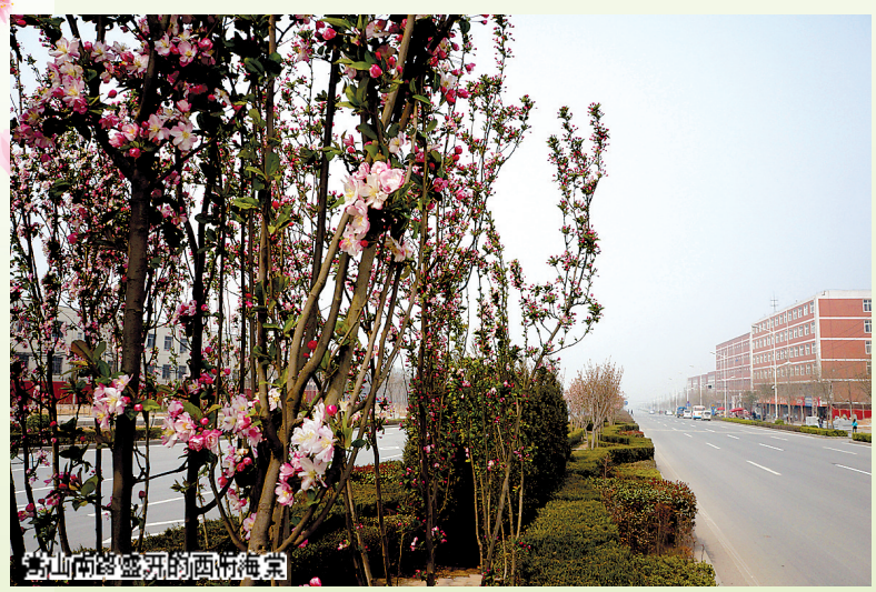
嵩山南路盛开的西府海棠