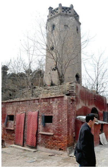
清末建的魁星楼如今沦落为厕所