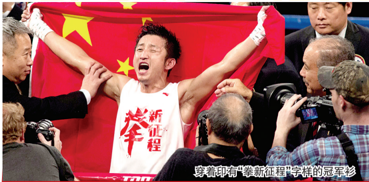
穿着印有“拳新征程”字样的冠军衫

昨晨，澳门威尼斯人酒店，戴了近20年头盔的两届奥运会拳击冠军邹市明摘掉头盔，站在职业拳击的擂台上，挥出自己的第一拳。在这场蝇量级四回合比赛中，31岁的邹市明凭借点数击败墨西哥18岁小将瓦雷祖拉，成功赢得开门红。邹市明赛后承认：“职业生涯的首场比赛，自己确实有一点紧张，希望以后能越打越有信心。”